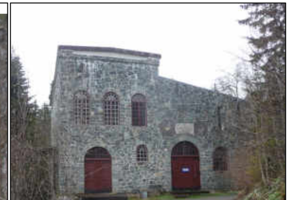
Sagbergfossen Kraftverk (1916)

Ved inngangen til året hadde Bekk og Strøm en årsproduksjon på 30 GWh. Etter kjøpet av småkraftporteføljen til NTE kommer den opp i drøyt 90 GWh. Og ambisjonene er langt høyere. (*)